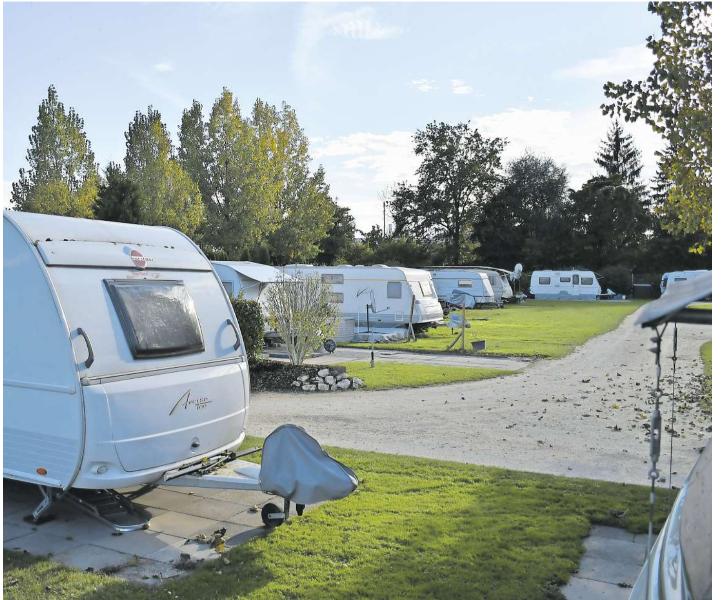
Das Jahr 2021 gestaltete sich für den Campingplatz im Aarburger Wiggerspitz erneut schwierig wegen der Coronakrise.

Das Umkrempeln der Camping-Beiz und des Badi-Kiosks ist nicht die einzige Neuerung im nächsten Jahr. Weiter soll der ZWKO 2022 einen neuen Präsi-